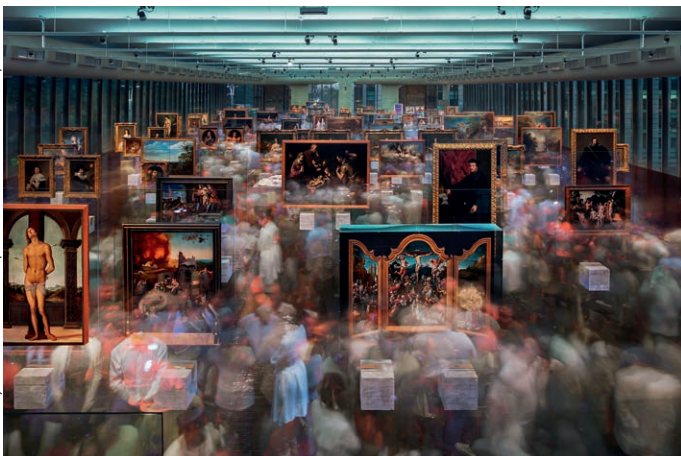
Abertura, Pinacoteca MASP (19.01 - 23.09 Uhr 10.12.2015)