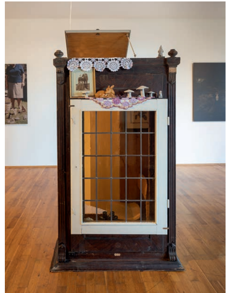
Haus Agnes, 2019, mixed media