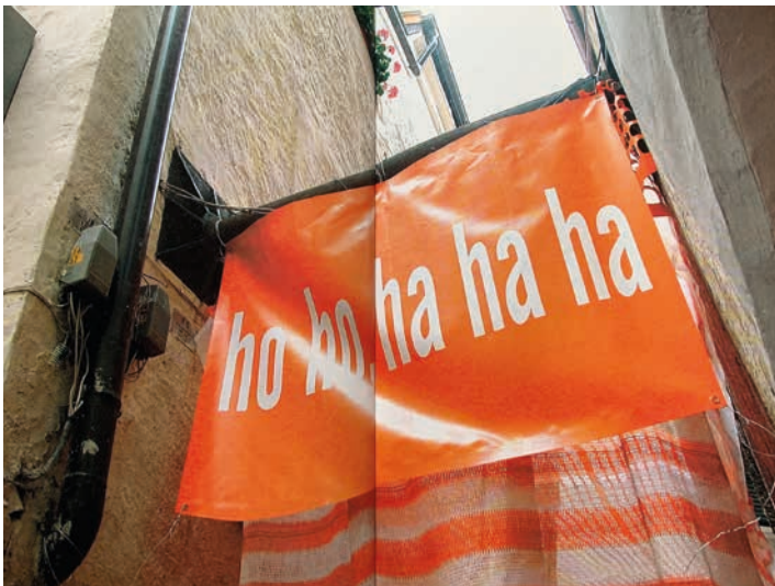
Professionell lachen lernen im Lachraum23