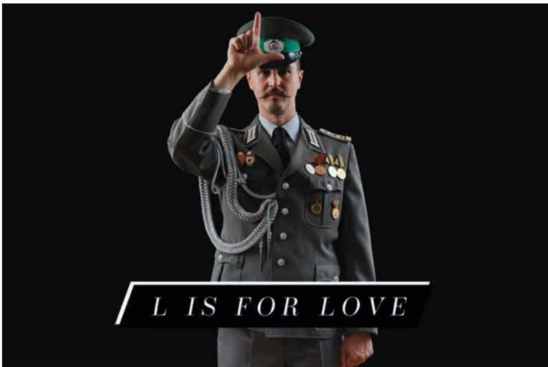
„Schrei es in die Welt hinaus – Arkadische Botschaften im Öffentlichen Raum“, Plakat von Manaf Halbouni

Das Thema des dritten Arkadien Festivals „Schöne Neue Welt“ ist ein Verweis auf Aldous Huxleys gleichnamigen Roman, der eine dystopische Zukunft entwirft, wie sie in den Augen mancher mehr und mehr Realität wird.