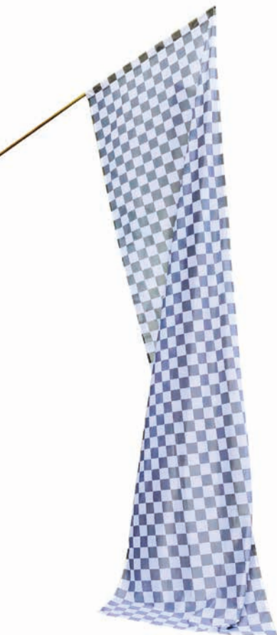
Eine „Neue Ebene“ in Photoshop verkörpert erst einmal: Nichts. Frenzy Höhne hat entsprechend die Fahnen gehisst.

Im Anschluss findet eine Filmvorführung aus der Residenz in Sofia statt.