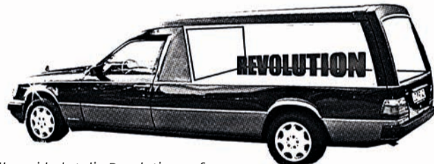
Manaf Halbouni bahrt die Revolution auf. Ist das das Ende?

Am Ende stellt sich die Frage: wann erreicht eine Revolution das Ende und ist nur die Revolution tot oder auch der revolutionäre Geist.