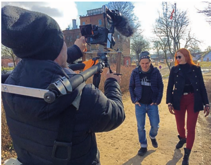
Sprechen über verschiedene Aspekte der transbiologischen Co-Existenz im städtischen Raum im Beitrag des Danziger Satelliten

*Auftragskomposition für das Arkadien Festival